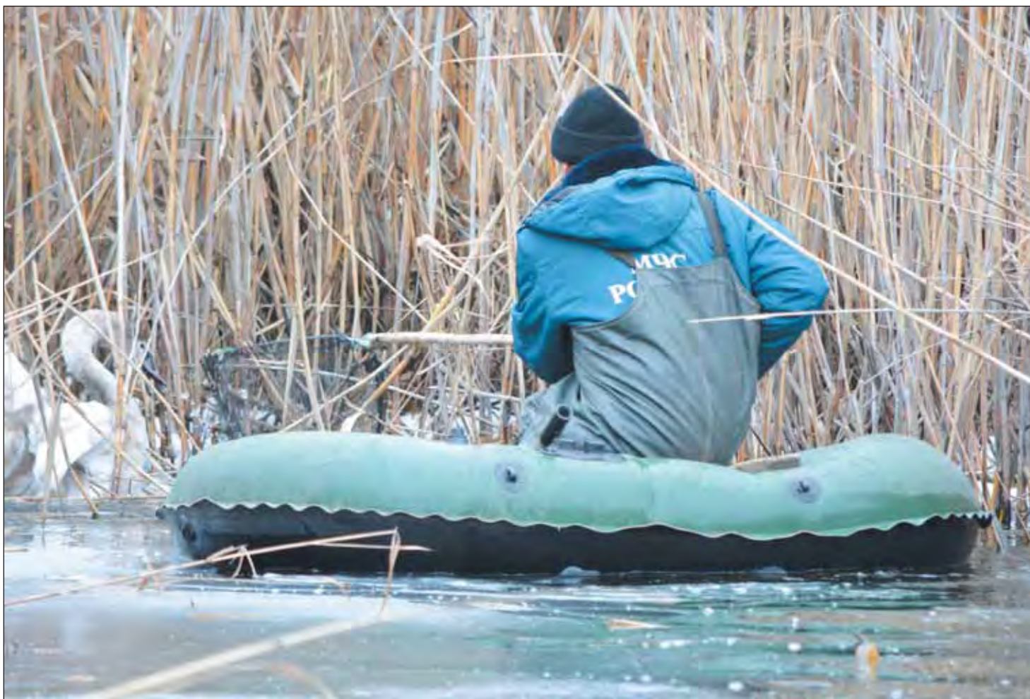
■ На то, чтобы извлечь лебедя из речной западни, ушло пятнадцать минут

— Будет жить! — сказали лофицкие ветеринары. — Только надо следить, чтобы гипс оставался целым, пока нога не заживёт. Покой и хорошее питание — вот что для него сейчас самое главное.