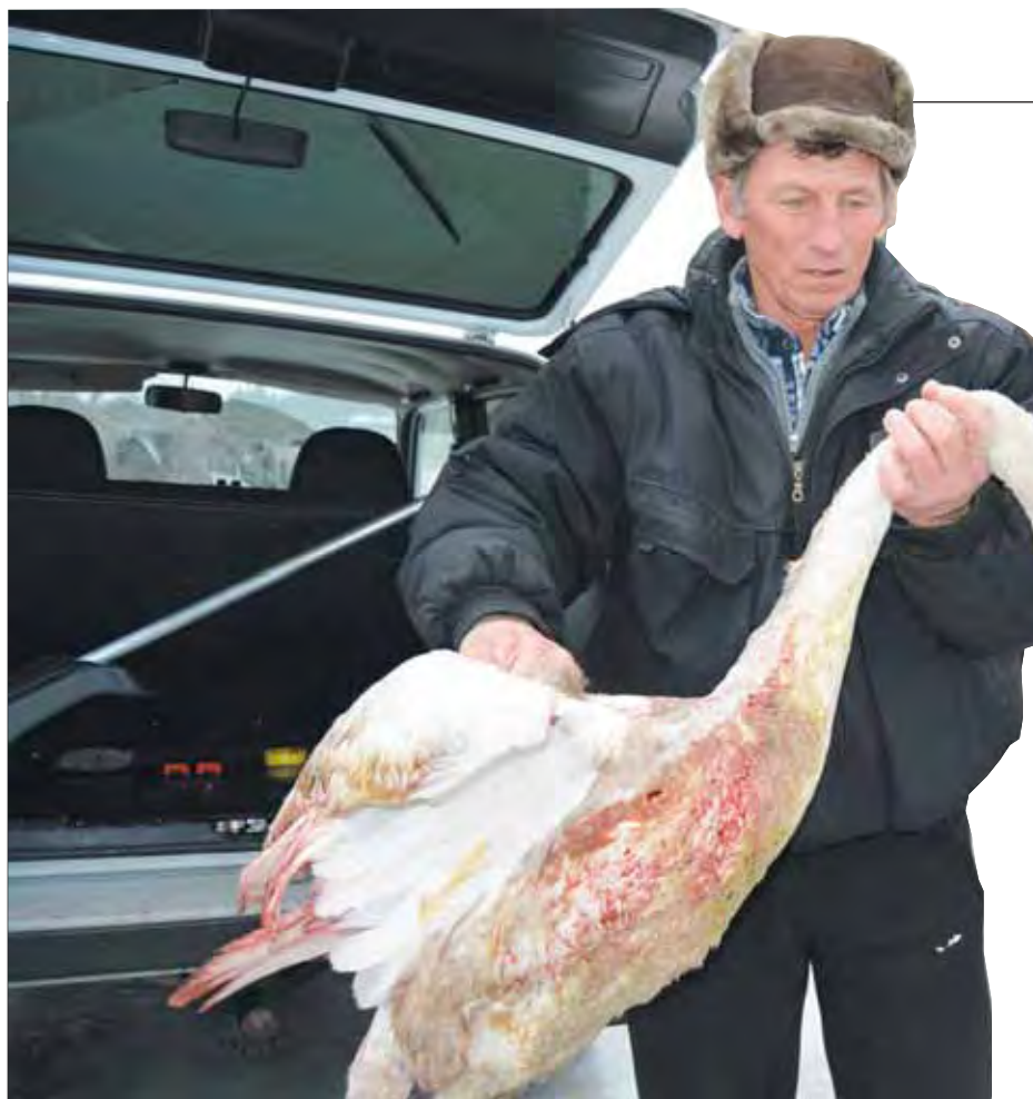
■ Кеше повезло: он попал в добрые руки