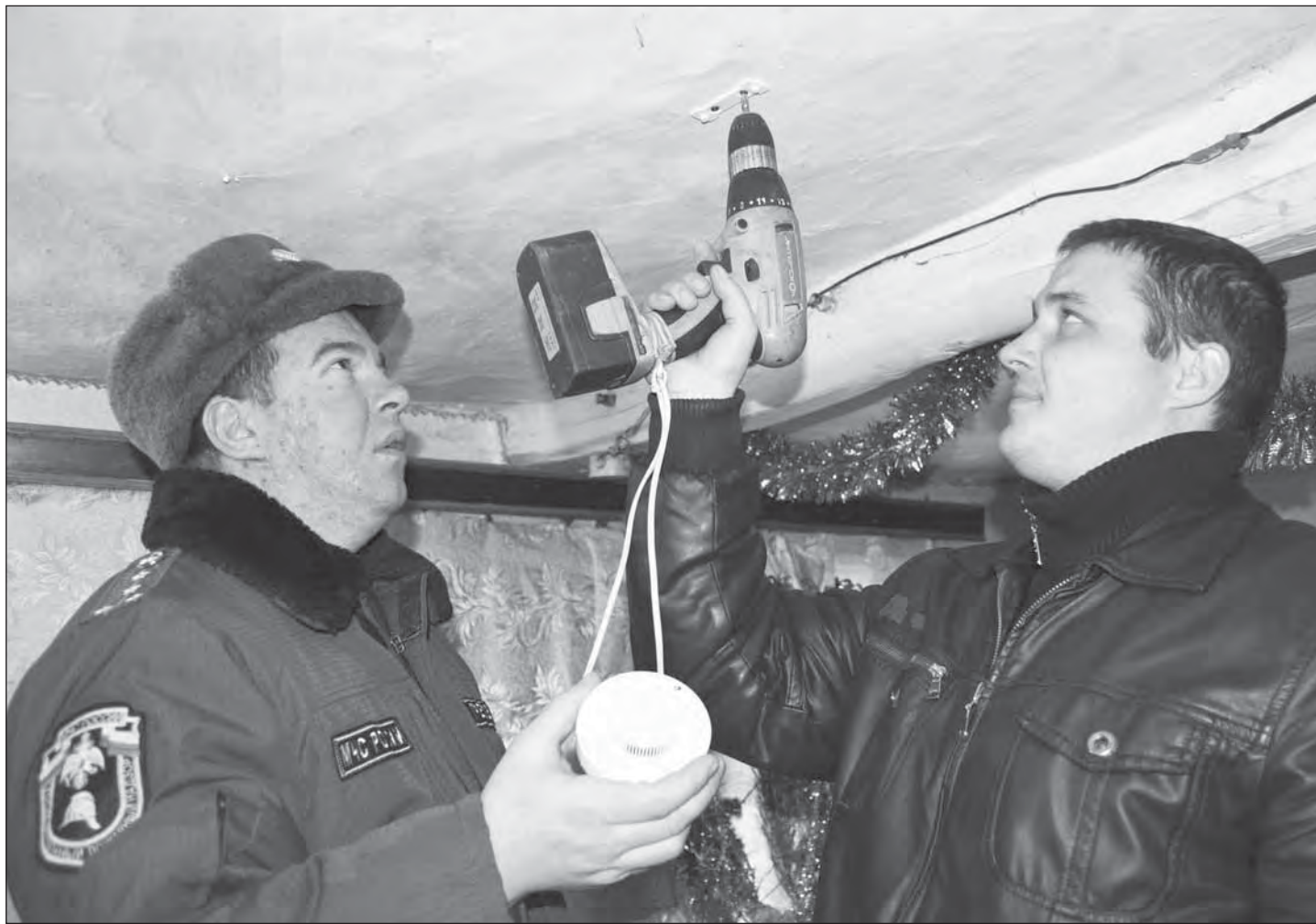
■ Противопожарные датчики устанавливают на потолке жилого помещения

За счет средств областного бюджета в 35 домах наших земляков появится система звукового оповещения