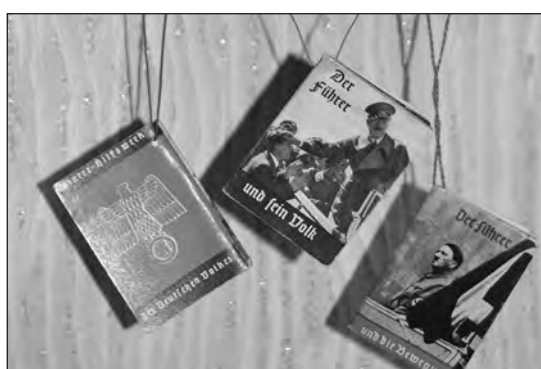
■ Такие украшения немцы вешали на елку

Любовь ГЕРУСОВА