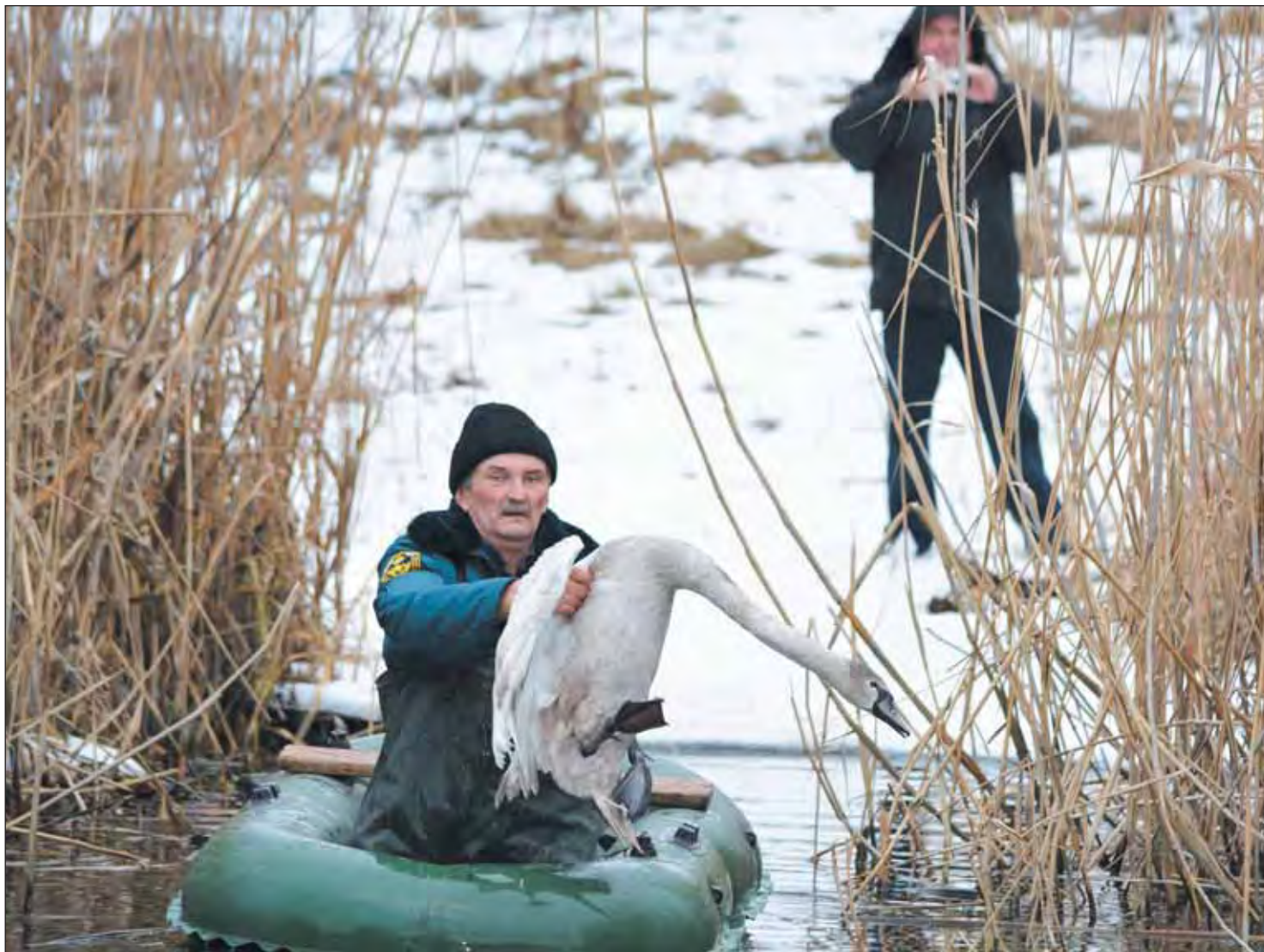
Левая лапка у лебедя была сильно поранена

Очередную акцию по спасению «братьев наших меньших» организовала редакция «СН»: на этот раз помощь была оказана раненому лебедю