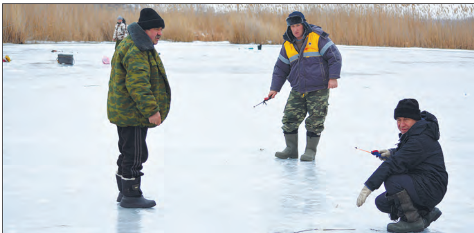
■ Зимняя рыбалка.

– Мы верим, что это нам тоже удастся, – говорят воодушевленные вервековцы. Любовь ГЕРУСОВА